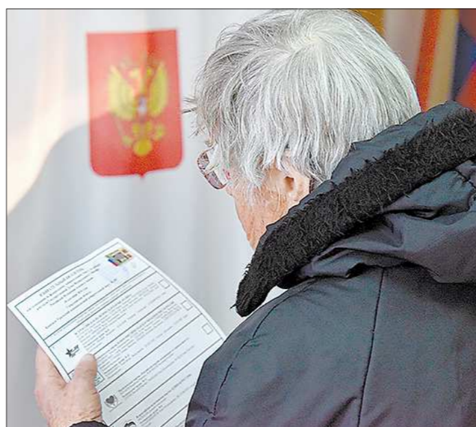
Выборы в муниципальные думы пройдут в 53 муниципалитетах. Своих кандидатов выдвинули 11 партий

— У нас произошли серьезные структурные изменения внутри регионального отделения: здесь создан и почти полностью сформирован аппарат партии, наделенный на четкую, регулярную работу. Соответственно, мы увеличили активность на выборах в муниципалитеты, чтобы развивать партийные проекты на территории Свердловской области. У партии сформирована «Средне-