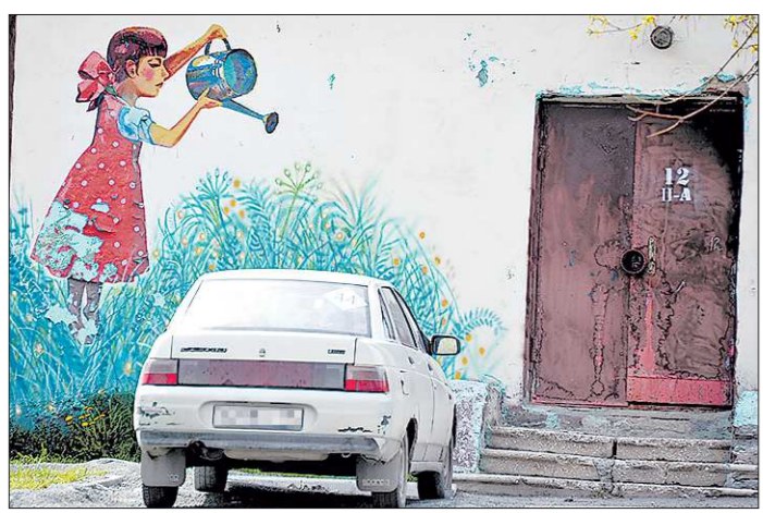
Господдержка помогла оживиться автокредитованию