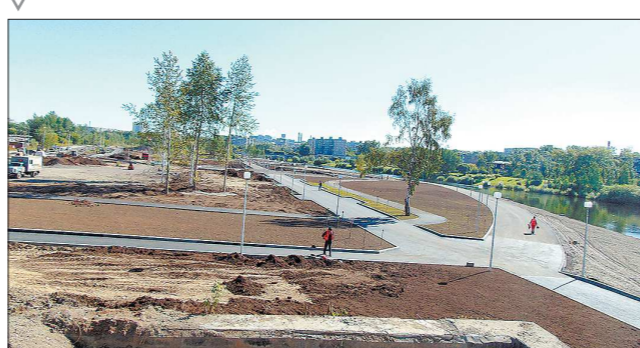
Ко Дню города тагильчане приготовили себе несколько подарков, которые сделают их жизнь удобнее и радостнее.

● Одним из крупнейших проектов стал парк «Народный» (на фото), строящийся между двумя новыми мостами вдоль реки Тагил. На глазах прибрежный пустырь превращается в трёхуровневый парк. Уже отсыпан галькой пляж, создана прогулочная зона с дорожками и скамейками. В следующем году начнётся строительство спортивных и игровых площадок. Строят парк тагильчане в складчину. Например, на отсыпку дорожек НТМК выделил 100 тысяч тонн шлака.