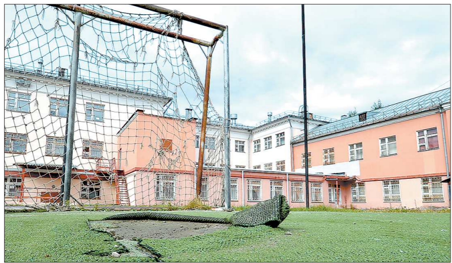
Вот что бывает со школьными дворами, которые открыты для всех желающих

Но удовлетворяет ли это аппетиты свердловчан? На самом деле — не очень. В целом на город таких мест (общедоступных и бесплатных) недостаточно. Для многих становится настоящей проблемой найти подходящее место рядом с домом, поскольку, для того, чтобы за-