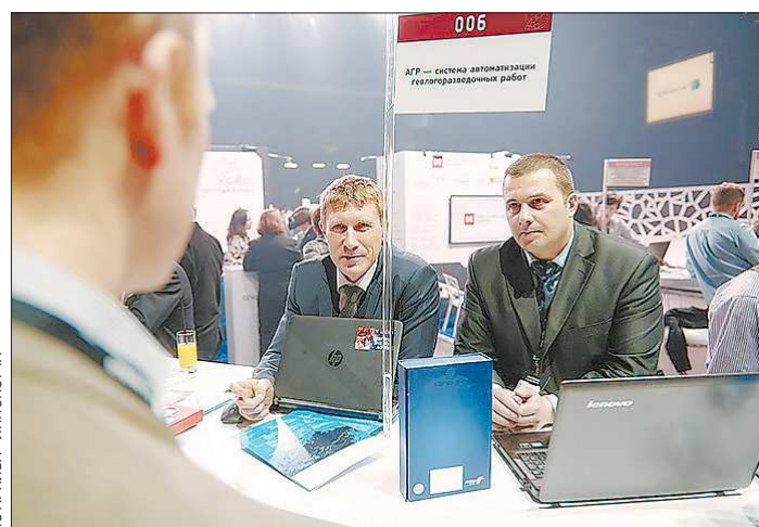
Прежде чем попасть на переговоры с инвесторами, авторы идей должны пройти собеседования и доказать состоятельность своих проектов

До 15 августа будет проходить сбор и сортировка проектов по темам, после чего начнётся приглашение заинтересованных инвесторов. По словам организаторов, 70 процентов стартаперов целился в ту нишу, которая раньше была занята импортом.