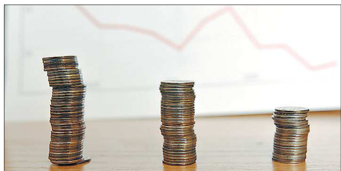
Социологи отмечают, что ценность сбережений падает, поэтому россияне предпочитают тратить, нежели копить