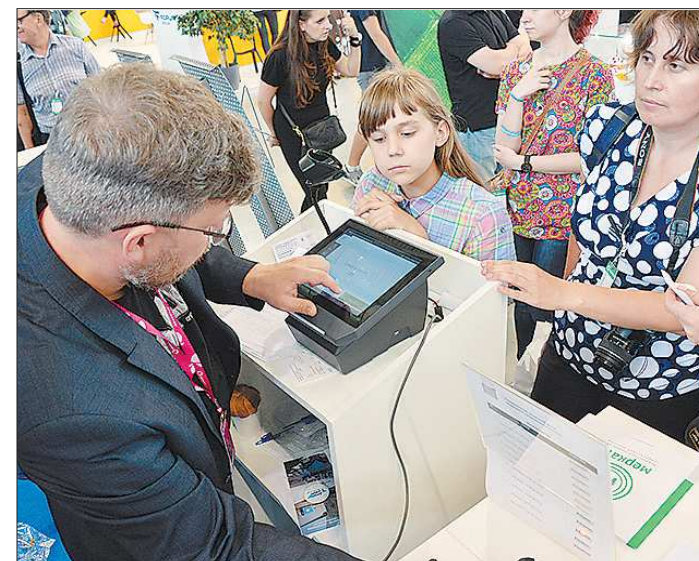
Цена нового оборудования — от 20 до 60 тысяч рублей в зависимости от комплектации