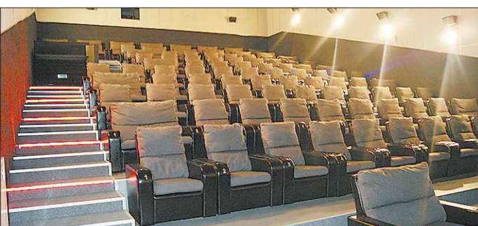
Уже в этом году в Екатеринбурге открылся юбилейный, 20-й, кинотеатр «Кинодом»

Екатеринбурец, предпочитающий открытую воду бассейнам, мечтает переехать в семь знаменитых проливов. Очередным стал Гибралтарский — от Испании до Марокко.