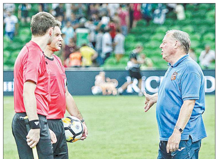
Александр Тарханов: «Николаев сказал, что пенальти был стопроцентный. Я ответил, что если он так считает, то ему нельзя судить»