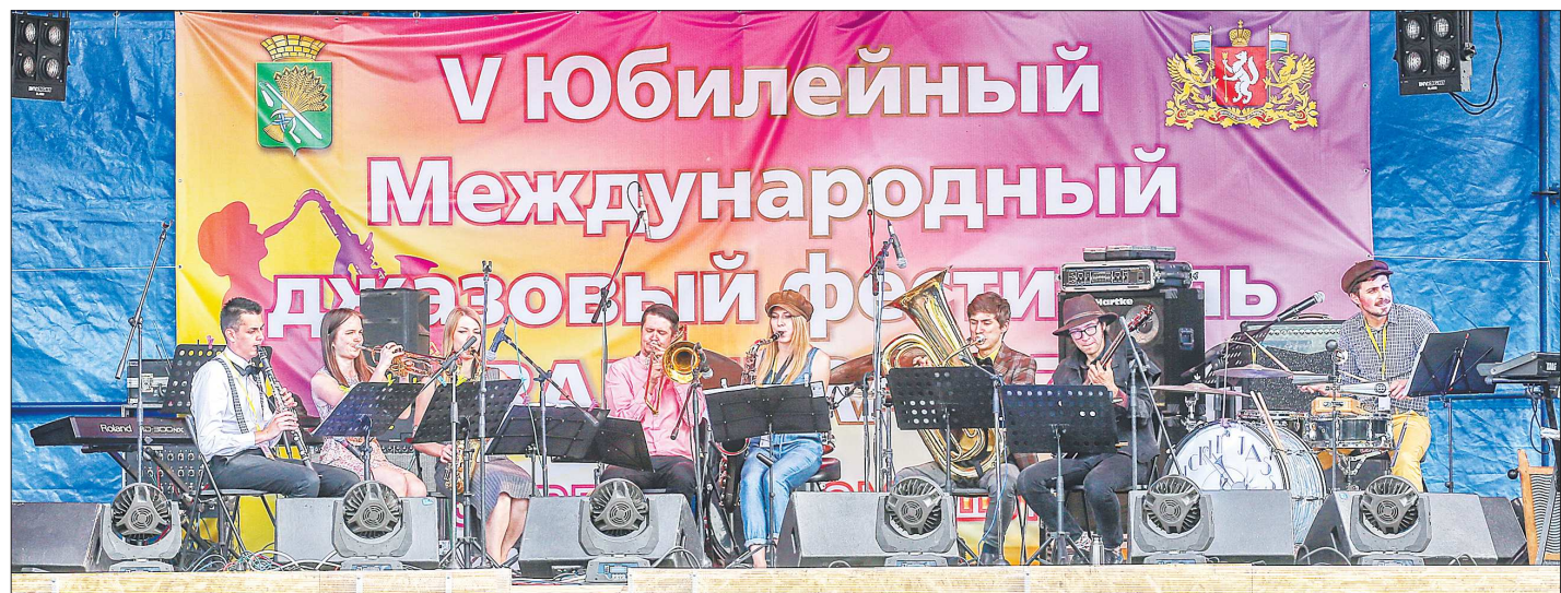
В Камышлове ансамбль Kickin' Jazz Orchestra познакомил гостей фестиваля с новоорлеанским джазом

Велоспорту на Среднем Урале более ста лет – первый спортивный сооружением Екатеринбурга в 1900 году стал велодром, располагавшийся на месте нынешнего Центрального стадиона. Евгению Куйвашеву понравилась идея оборудовать для велосипедистов набережную Шарташа.