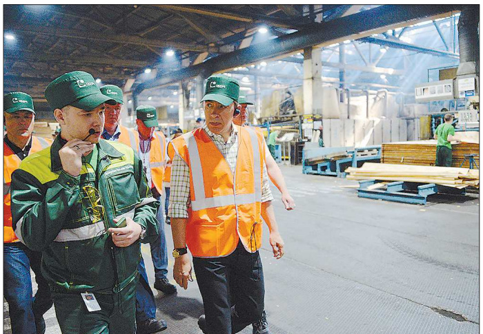
На заводе «СВЕЗА» главе региона продемонстрировали полный цикл производства фанеры и модернизированное оборудование

В планах — формирование заявки на вхождение в число приоритетных инвестпроектов области в сфере освоения лесов.