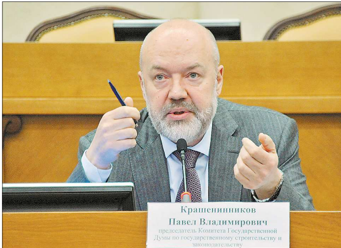
Депутат Государственной думы РФ от Свердловской области Павел Крашенинников разъяснил читателям ОГ суть изменений в финансовом и наследственном праве

— Важной новеллой является введение в Гражданский кодекс понятия «ростовщические проценты». Речь идет о процентах за пользование займом в сфере непрофессиональ-