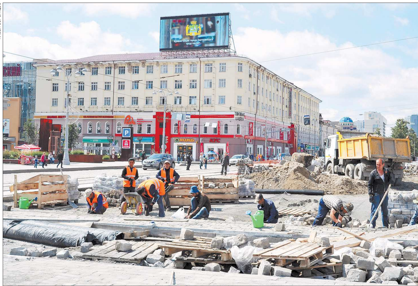
Перекладка брусчатки на площади 1905 года в центре Екатеринбурга

Успеет ли Екатеринбург подготовиться ко встрече гостей со всего мира?