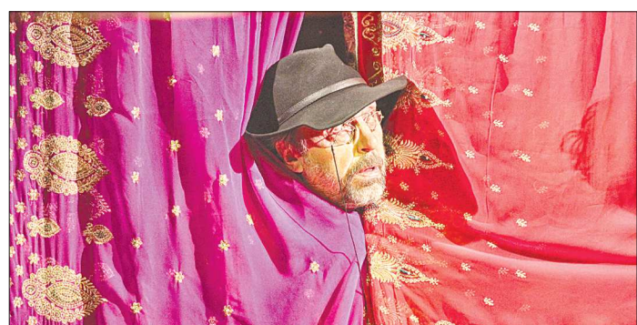
Несмотря на то, что «Двенадцать стульев» не так давно появились в репертуаре театра, постановка уже успела полюбить зрителей. Все билеты на август распроданы