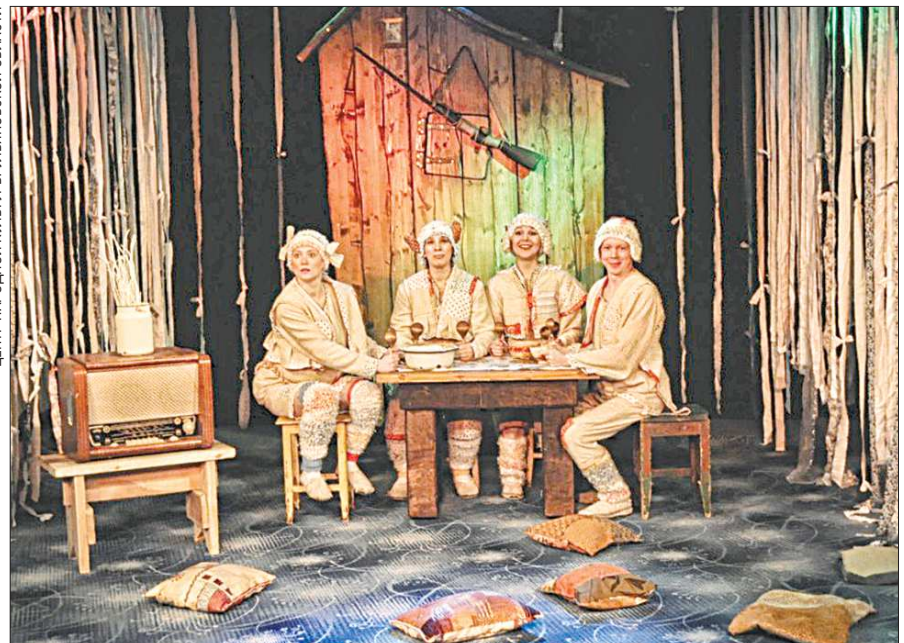
Сцена из спектакля «Зимовье зверей»