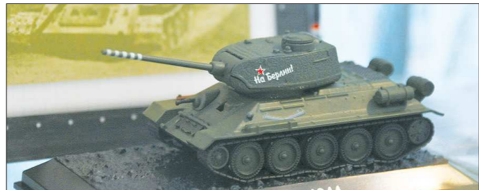
На выставке можно увидеть копии уникальных документов, фотографии, исторические фильмы, макеты боевой техники