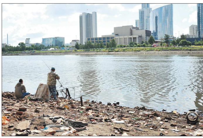
Рыбаков, пришедших за нехитрым уловом, свалка на берегу пруда, кажется, ни капли не смущает

Городской пруд в районе Макаровского моста в Екатеринбурге на днях обмелел так, что по его дну ездят спецтехника и разгуживают рабочие в ботинках. Уровень воды в пруду за месяц целенаправленно понизили для подготовки реконструкции моста: река под мостом превратилась в ручейк и бежит только под одним пролётом.