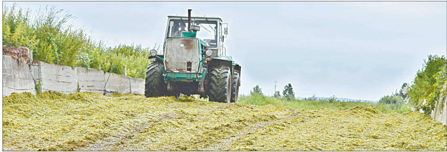
В поле идёт уборка трав на силос