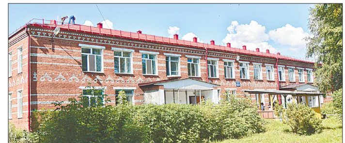
Закончен капитальный ремонт кровли Ачитского детского сада «Тополь»