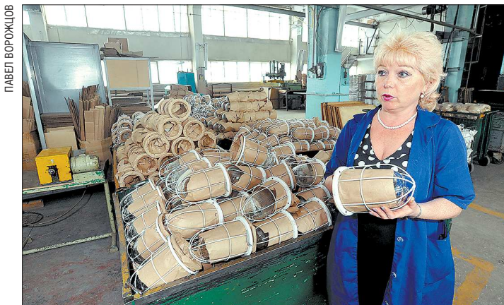
На Ревдинском заводе светотехнических изделий производят до тысячи светильников в день

вооружению предприятий, поэтому здесь современное оборудование. Продукцию потребители ценят за качество, хотя по себестоимости она не самая дешёвая на рынке.