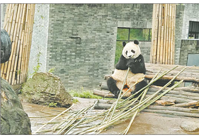
Панда может вырасти до 1,8 метра и весить 150-160 кг

В китайских городах Чэнду и Сиань можно познакомиться с пандами и посмотреть на терракотовую армию — глиняных воинов в человеческий рост. Журналист «ОГ» по приглашению генконсульства КНР в Екатеринбурге в составе делегации сотрудников СМИ увидела важнейшие достопримечательности Поднебесной, о которых в России пока мало знают.