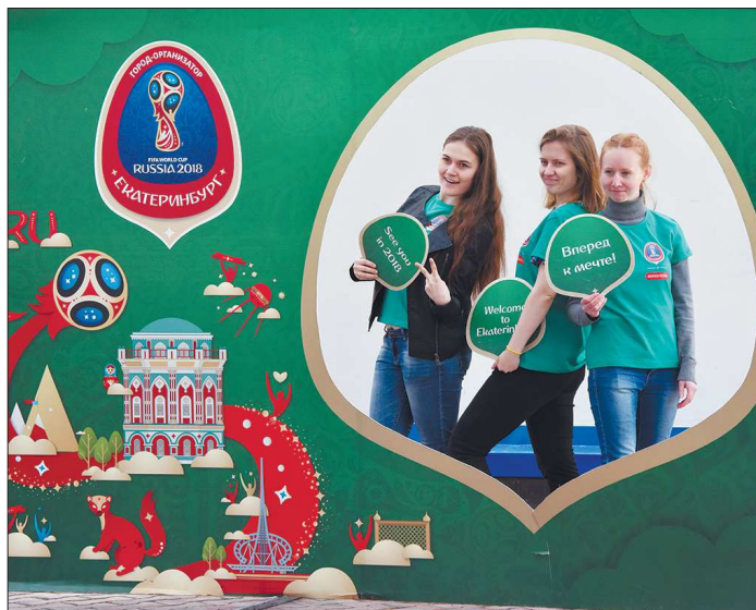
В Екатеринбурге вовсю продолжается подготовка к чемпионату мира, отдельное внимание уделяется волонтерам

Первые билеты появятся в продаже на официальном сайте ФИФА. Именно через него, как это было на Кубке Конфедераций, болельщики могут оставить заявку на билеты. Примечательно, что изначально оплачивается просто заявка на билет, а уже позже ФИФА информирует о том, что заявка одобрена, и вам указывается сектор и место на стадионе. Никаких квот для местных болельщиков в городах-участниках не существует, тут, как говорится, кто успел. Но для российских болельщиков будет выделено не менее 350 тысяч билетов. Позднее билеты (при условии их наличия) можно будет купить и в Цен-