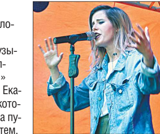
Elvira T была долгожданной гостьей в Карпинске

Карпинцы получили отличный подарок ко Дню города: концерт ведущих артистов российской эстрады.