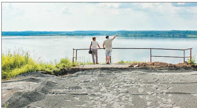
Эта площадка ценна не только как память, но и как туристический объект – отсюда открывается потрясающий вид на водную гладь

Нынешним летом в Карпинске будет отремонтирован один из самых значимых объектов – смотровая площадка на бывшем угольном разрезе. В данный момент площадка находится в плачевном состоянии – часть её обвалилась, что, безусловно, может угрожать жизни и здоровью людей.