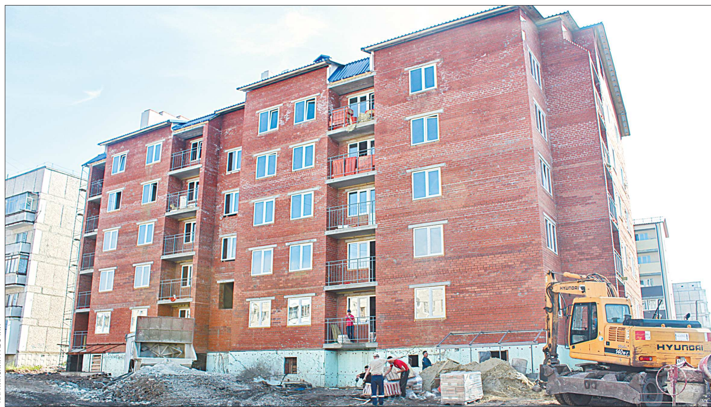
Нынешней осенью 57 карпинцев получат новые квартиры в этом доме

Восемь новых домов заселены в Карпинске с 2013 года. Девятый – сейчас на стадии внутренней отделки и будет сдан осенью. Такого строительного бума в городе не было с прошлого века.