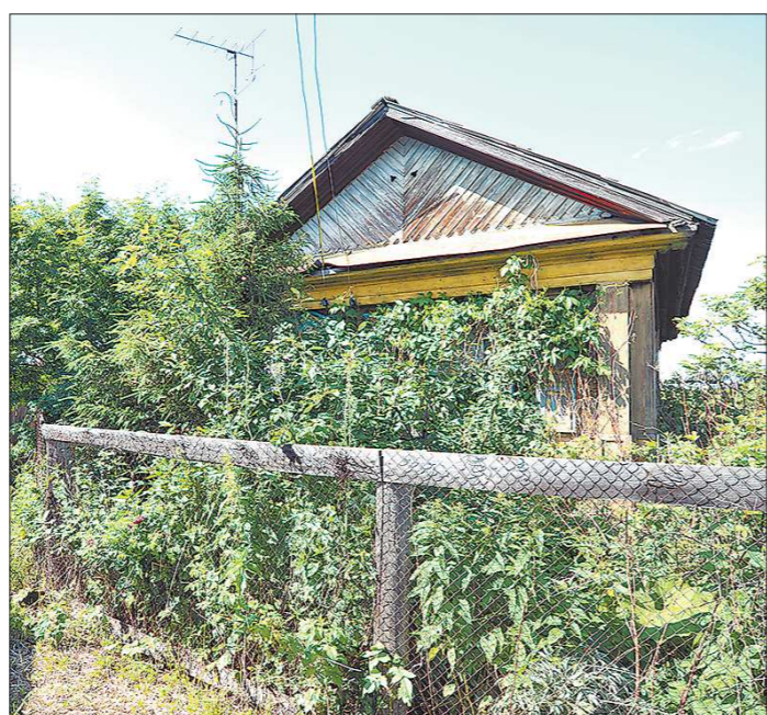
Дача Николая Коляды снаружи...

— Это диван поэта Бориса Рыжского, — поясняет Коляда. — Когда я был редактором журнала «Урал», Рыжий сказал, что в редакции должен быть диван. Купил де-