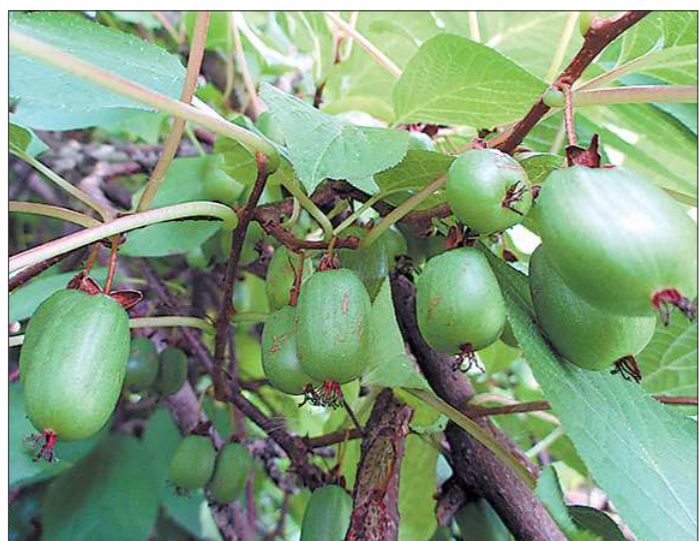
Две-три ягоды актинидии дадут вам суточную норму витамина С

— В 60-е годы прошлого века первым, кто создал в Советском Союзе лабораторию по изучению полезных свойств растений, был уральский учёный Леонид