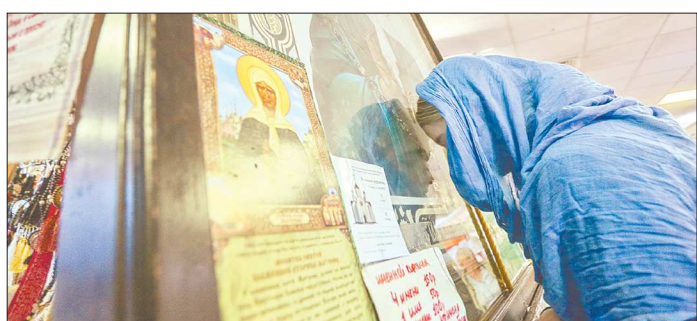
Считается, блаженная Матрона Московская помогает исцелиться от тяжёлых болезней