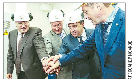
При участии Евгения Куйвашева на СУМЗе ввели в эксплуатацию новую кислородную станцию

Успешно реализуются крупные инвестиционные проекты. Так, на Каменск-Уральском металлургическом заводе сооружается прокатный комплекс по выпуску импортзамещающей стали для авиа- и ракетостроения. Свердловский трубный завод обновляет трубопрокатное производство. Корпорация «ВСМПО-АВИСМА» и компания «Боинг» готовятся открыть совместное предприятие по механообработке титановых штамповок для самолётов в особой экономической зоне «Титановая долина». УГМК-Холдинг реконструирует мощности своих заводов в Ревде, Верхней Пышме и Красноуральске.