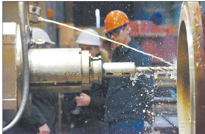
Крупные предприятия охотно вкладывают средства в подготовку кадров в корпоративных учебных центрах

Эту брешь в подготовке кадров крупные промышленные предприятия пытаются закрыть самостоятельно, создавая свои учебные центры.