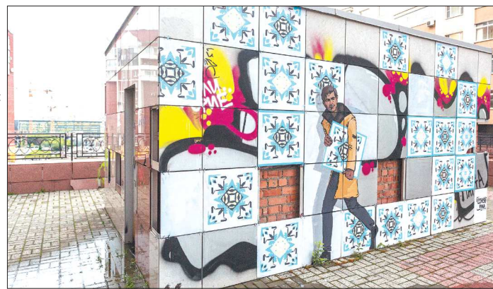
В рамках «Стенограффии» екатеринбургский художник Esher нарисовал воришку, уносящего плитку с будки (улица Шейнкмана, 73)