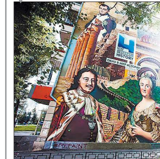
В 2014 году в Екатеринбурге на улице Попова, 9/16 появился гигантский портрет Петра I и Екатерины II . Через несколько лет зданию потребовался ремонт: чтобы удалить старую штукатурку, «под нож» пустили и шикарный рисунок — стандартное окончание «земного пути» стрит-арт-работы

ся как к искусству, а не как к банальному мариано зданий. Но до идеального контакта ещё далеко. Об этом свидетельствует недавний случай. В одном из дворов Уралмаша художник закрашил машину и гараж-ракушку, как будто вырезал их из пространства с помощью «Фотошопа». Часть пользователей Сети резко высказалась в адрес авторов работы, посчитав, что машину разрисовали нелегально. Несмотря на то, что оба объекта уже были заброшены и не эксплуатировались, мы всё равно заранее договорились с её хозяином и хозяином гаража. Так что всё было по закону. После эти объекты будут вырезаны из