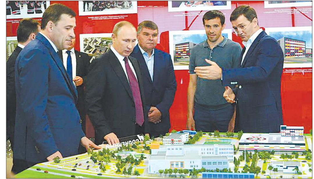
По мнению главы региона, завершение строительства «Арены Авто» выведет развитие детско-юношеского хоккея в Свердловской области на новый уровень

Проект строительства «Арены Авто», презентованный Владимиру Путину, также реализуется на средства президентского гранта, полученного за победу в Ночной хоккейной лиге в мае 2016 года другой уральской командой — «Авто». Евгений Куйвашев доложил главе го-