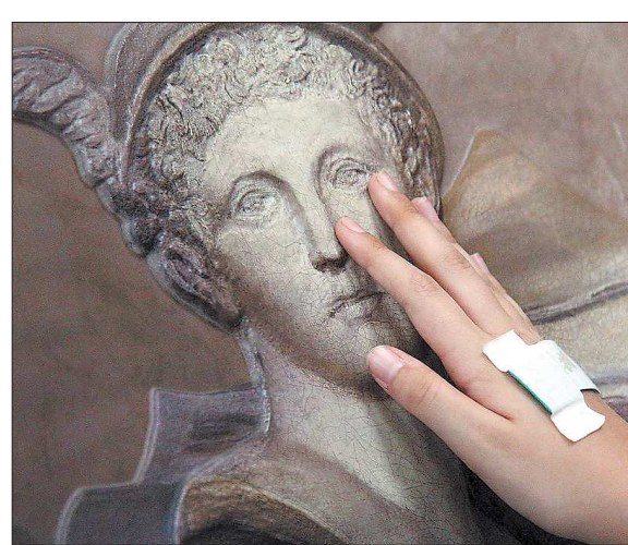
Рельефные картины на этой выставке можно и нужно трогать

В прошлом году «Динамо-Строитель» дважды проиграл своим оппонентам и, наверно, в этом году планирует больше порадовать своих болельщиков. Теперь остаётся ждать самих матчей и надеяться, что сюрпризы будут только на поле, а капризная погода порадует своим гостеприимством.