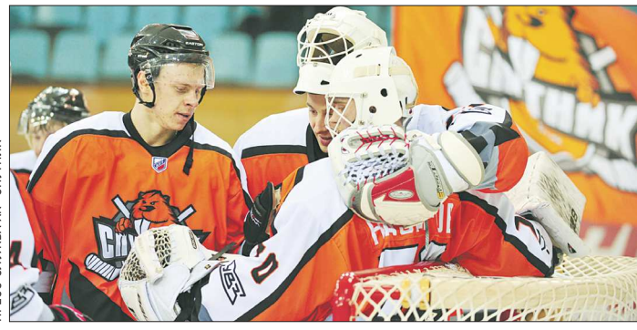
Четвёртое место в регулярном чемпионате сезона 2016/2017 стало рекордным для «Спутника», а в плей-офф остановились в четвертьфинале

«Вы довольно амбициозный человек. Когда вы делаете кино, есть ли у вас страхи быть непонятым? – Когда я делаю фотографию и выкладываю её в Instagram, уже есть страх быть непонятым. Не говоря уже про целый фильм. Но этот страх должен быть и ты должен каждую секунду его преодолевать. И не дай бог, чтобы он пропал, и ты бы стал абсолютно уверенным в себе. Это хуже всего.»