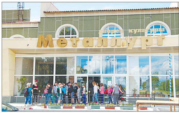
По условиям договора с Фондом кино, модернизацию кинозалов «третьей волны» обязаны завершить до конца 2017 года. Красноуральский Дворец культуры «Металлург» сдали первым из свердловских учреждений