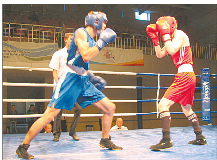
Хозяева соревнований завоевали в этом году 18 медалей – 8 золотых, 4 серебряных и 6 бронзовых

● 15 июля – закрытие Венского фестиваля музыкальных фильмов. Впервые в истории Венского фестиваля финал мероприятия проведут DJ-парадом, вся площадь превратится в огромный танц-пол. Так организаторы хотят привлечь молодую аудиторию интереса к классической музыке. В течение нескольких часов под открытым небом несколько популярных специально приглашенных диджеев, сменяя друг друга, будут играть миксы на основе классических произведений Моцарта , Шуберта и Штрауса .