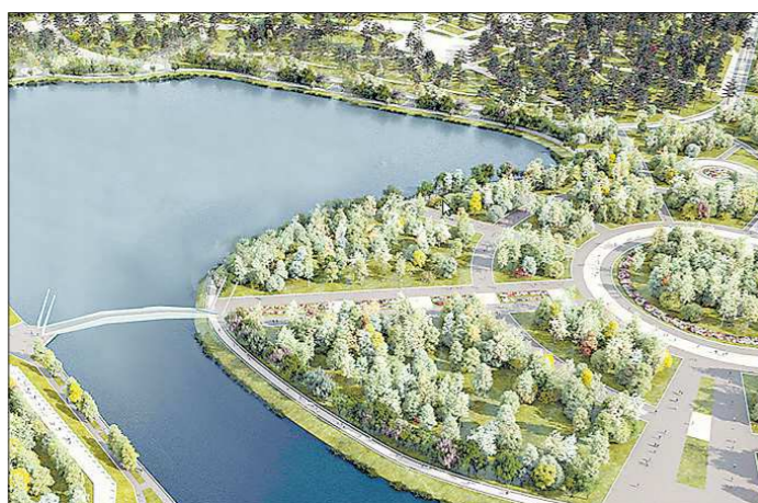
Урбанизированную набережную и «полуостров» ЦПКиО соединит мост