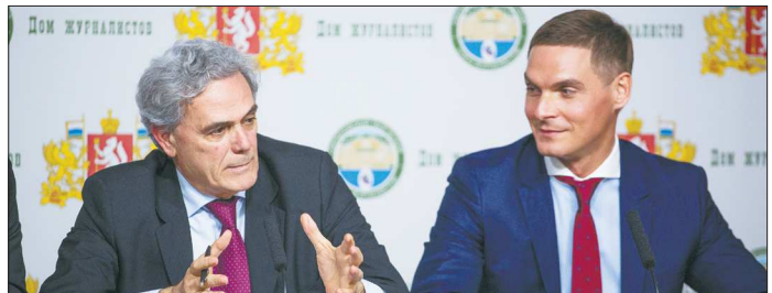
В начале мероприятия посол пожаловался на уральскую непогоду — через час в окне засияло солнце

— В итальянском языке есть пословица, гласящая: «Если это роза — то она зацветет», — рассказал господин Рагальини, четвертый год возглавляющий дипломатическую миссию своей страны в России, — это означает, что если идея хороша, если вы всё правильно делаете, то обязательно достигнете цели. Поэтому я вам желаю, чтобы розы зацвели — это касается и ЭКСПО, и новой линии метро, и многого другого.