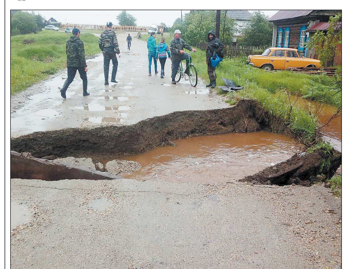
Улицы Махнёво после сильных дождей превратились в венецианские каналы. Вода подтопила несколько десятков частных домов и размыва асфальтовое покрытие (на снимке). Жители с трудом могли попасть в свои подворья, а автомобилисты — проехать по дороге: кое-где проплыть можно только на лодках. Пожарная ситуация — ещё в нескольких муниципалитетах. Так, в Виделе оказались затоплены 37 подворий, несколько человек пришлось эвакуировать