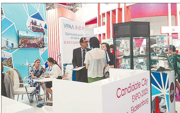
Мероприятия выставки посетили около 240 тысяч человек

Свердловское предприятие «Экопром» из посёлка Озёрный Режевского района планирует поставлять торф в КНР, а также локализовать в Харбинской технико-экономической зоне предприятие по производству экологически чистых удобрений для выращивания сельхозпродукции. Об этом «ОГ» сообщили в министерстве международных и внешнеэкономических связей Свердловской области.