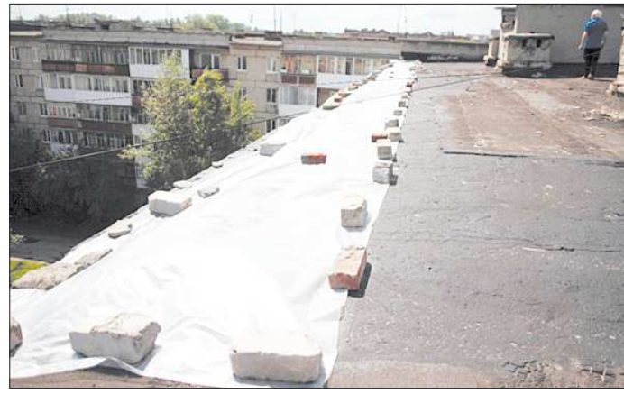
Специалисты укрыли крышу полистиролом, но предупредили, что от дождя он не спасёт

Рефинансирование под меньший процент снижает нагрузку на бюджет, но только на время. 400 миллионов рублей, взятых у банков сейчас, через год надо будет возвращать. И город снова возьмёт новый займ? Евгений Черемных поясняет: при истечении срока кредитного договора город может подготовить документы для ещё одного перекредитования — взять новый займ, чтобы погасить старый.