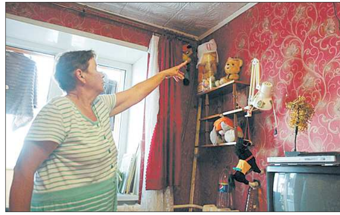
Подтёки подпортили потолки и обои в квартирах на верхних этажах