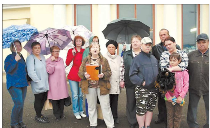
Жители Североуральска попросили вернуть поезд «Бокситы — Екатеринбург»