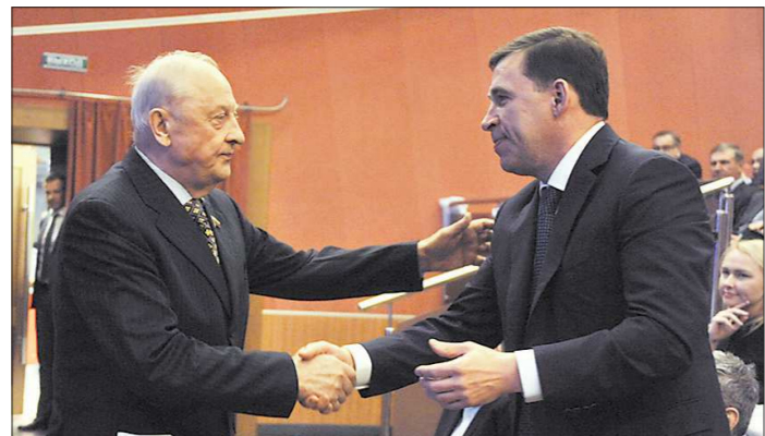
По словам Эдуарда Росселя, он «убеждён, что Евгений Куйвашев — очень сильный кандидат, который поднимет нашу область ещё на одну ступень»

Член Совета Федерации, экс-губернатор Свердловской области Эдуард Россель заявил, что концепция программы Евгения Куйвашева «Пятилетка развития» полностью совпадает с его видением, как должен развиваться регион. Об этом он объявил в прошлые выходные во время выступления на конференции регионального отделения «Единой России». «ОГ» решила сравнить две предвыборные программы: «Будущее Урала», с которой Эдуард Россель избрался на третий губернаторский срок в 2003 году, с вышеупомянутой «Пятилеткой» и посмотреть, в чём пересекаются взгляды политиков.