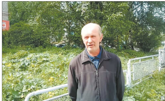
Серовчанин попросил газифицировать частный сектор