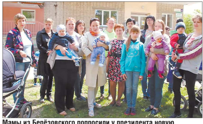
Мамы из Берёзовского попросили у президента новую поликлинику

Среди вопросов, отправленных на «Прямую линию» с Президентом России Владимиром Путиным, были и заданные жителями Среднего Урала. Пусть они не попали в прямую эфир, но их зафиксировали и передали в администрацию президента. Вопросы свердловчан касались возвращения отменённого поезда, газификации частного сектора, уличной торговли, строительства поликлиники, поддержки обманутых дольщиков и инвалидов