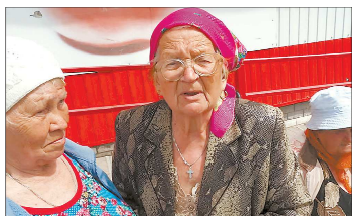
Пенсионерки из Карпинска пожаловались, что им запрещают продавать урожай у магазинов