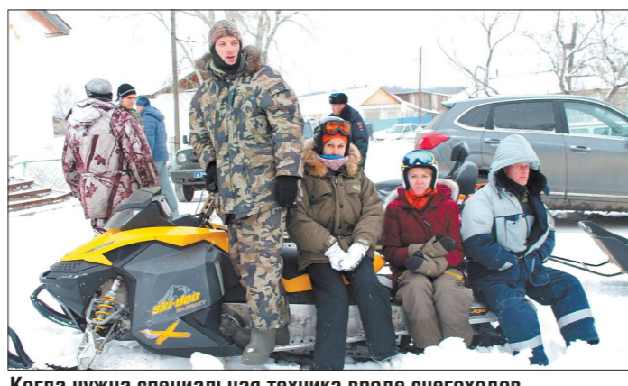
Когда нужна специальная техника вроде снегоходов, волонтеры бросают клич в социальных сетях и, как правило, быстро находят помощников