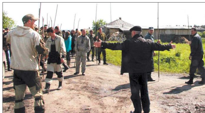
При поступлении сигнала о пропаже человека координаторы сообщают добровольцам о времени и месте сбора, а также о необходимой амуниции