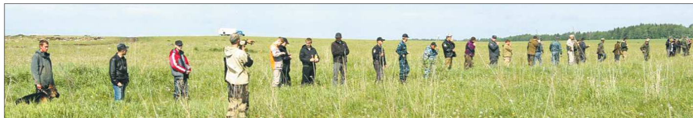
По статистике поисковых отрядов, больше всего людей теряется летом

Он отметил, что на территории нашего региона в этом отряде есть костяк — человек 50, которые постоянно находятся на связи, при необходимости координируют действия остальных добровольцев, периодически проводят для них лекции по технике поиска и тренировочные выезды в лес. Когда необходима помощь добровольцев, «сигнал тревоги» подается в социальную сеть «ВКонтакте»: сообщается время и место