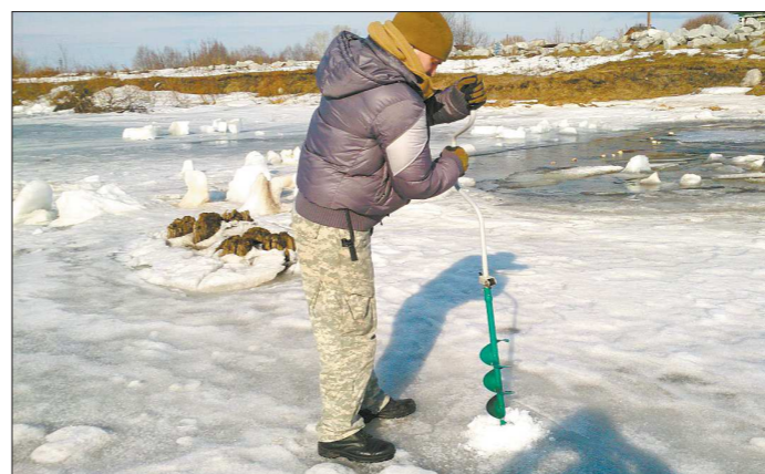
Волонтеры прорабатывают все возможные варианты развития событий — пропавших ищут и на суше, и в воде, и подо льдом...

а в той местности, где пропал ребёнок, болото. Вода, пусть и грязная, у него была. Без еды взрослый человек может прожить две недели, маленький ребёнок неделю выдержит. Самая большая опасность, которая ему угрожала — это переохлаждение, — утверждает наш собеседник. По его словам, за помощью в поисково-спасательные отряды практически ежедневно обращаются близкие тех, кто потерялся. Зачастую пожилые люди теряются из-за провалов в памяти и дезориентации. Дети, подростки убегают из дома после конфликтов, иногда по каким-то причинам уходит из дома и взрослые люди. Бывают и криминальные случаи. К сожалению, поиски не всегда дают положительные результаты, но многих