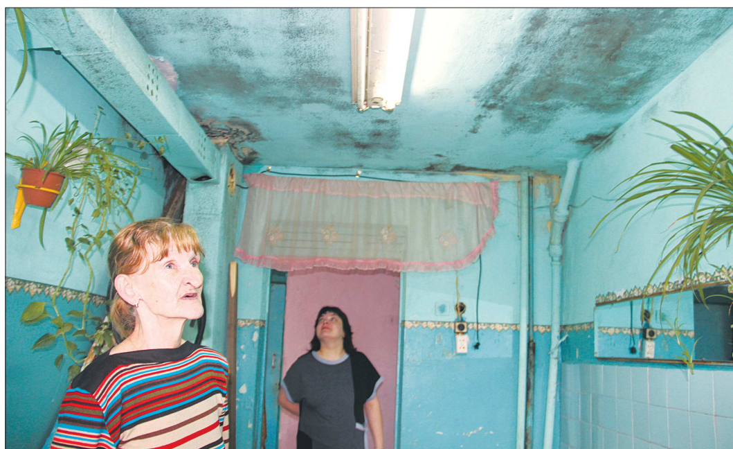
Потолки и стены бывшего общежития на Горького, 1а покрываются плесенью

С другой стороны, страдает экология. Как ни крути, наличие шаткое равновесие между природой и освоением её богатств. От того, как активно будут промышленники заботиться о будущем здоровом экомире, будет зависеть красота и содержание нашей малахитовой шахтулки – города, сказочно богатого недрами и мастеровыми людьми. Интересно, о чём бы рассказал дедушка Слышко, родился он в наше время?