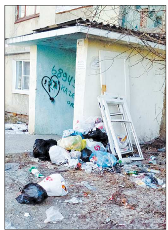
Так выглядит общежитие на улице Розы Люксембург, 14

Сейчас по прямым договорам с собственниками помещений Полевская коммунальная компания обеспечивает