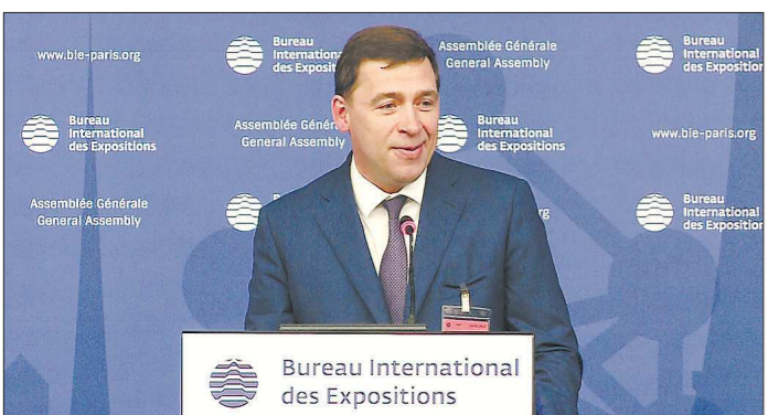
Евгений Куйвашев уверен, что Екатеринбург станет «настоящим открытием для глаз и сердец тех, кто его посетит»