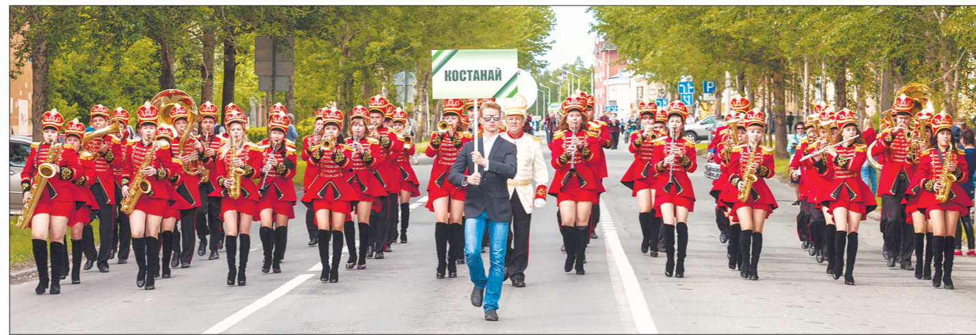
Иностранцы в Новоуральске! Духовой оркестр из Казахстана шествует по улице Первомайской по площадке перед культурно-спортивным комплексом, где ему вручат главный приз фестиваля – Кубок Росатом