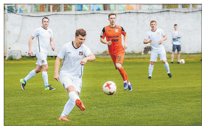
Журналист «ОГ» вышел на поле с первых минут матча и играл на позиции правого полузащитника

Но никто из болельщиков не расстроился, ведь такой шанс выпадает, пожалуй, раз в жизни. «Играй за тех, кто не попал в профессиональный футбол», – сказал мне один знакомый. И я это сделал.