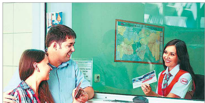
проходящих — каждый сможет подобрать для себя удобный вариант. А ещё очень популярны этим летом поезда по «единому билету» в Крым (с использованием автобуса и паромов) и Абхазию. Их можно оформить в кассе или через Интернет.

Дополнительные составы до Анапы будут формироваться из купейных и плацкартных вагонов. Из Екатеринбурга поезд №595У отправится к морю утром 10, 17, 24 и 31 июля, а также 15, 22, 29 августа. Из Тюмени ночью 2 и 22 июля можно будет уехать поездом №595И.