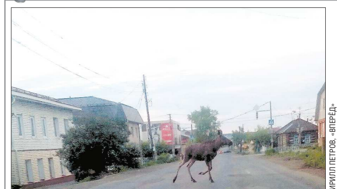
В выходные по центру Красноуфимска проскакал лось, сообщает газета «Вперёд». Фотографией в соцсетях поделился горожанин: сохатый попал в кадр в пять утра, когда перебежал дорогу в нескольких метрах от автомобиля. Откуда в городе появился необычный гость, неизвестно, однако пользователи соцсетей сообщают, что дней два и даже полтора видели возле деревень Куянок и Калиновка