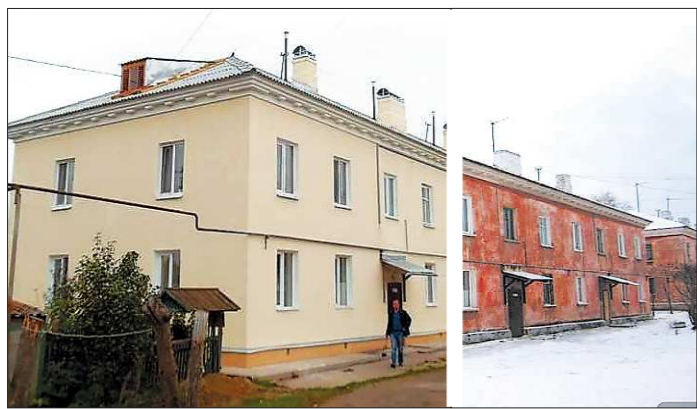
Сухой Лог, которым Станислав Суханов руководил больше восьми лет, в числе первых приступил к реализации программы. Вот вид одного из домов после и до ремонта