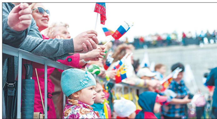
В День России в Свердловской области пройдёт большое количество праздничных мероприятий, на которых будет интересно как детям, так и взрослым