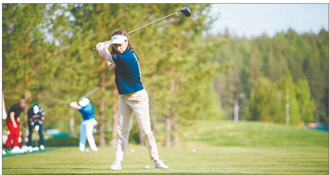
Из-за сложной техники в гольфе важна системность занятий – спонтанными набегами в выходные дни результата не добьёшься

Гран-при фестиваля (это вторая по значимости награда) получил француз Робен Кампидо за фильм «120 ударов в минуту». Лучшим режиссёром стала София Коппола, а статуэтки за лучшие работы получили Хоакин Феникс и Диана Крюгер.