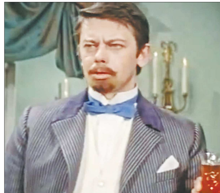
Александр Демьяненко в роли Виктора Бахарева в фильме «Приваловские миллионы», 1972 год