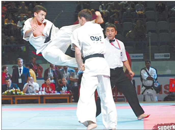
Киокусинкай считается одним из самых трудных и жёстких разновидностей карате