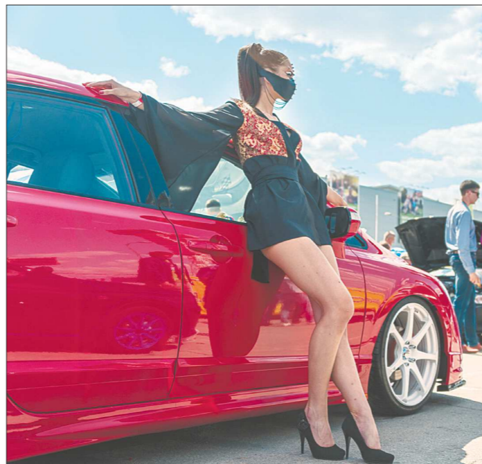
Предложения банков по автокредитам весьма заманчивы