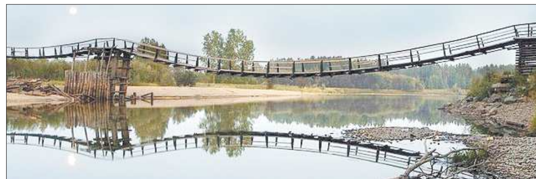
Таким был подвесной мост несколько лет назад. На другой берег ходили порыбачить, за грибами и шишками

Через территорию нашего города протекают две реки, но места отдыха, как это ни странно, у горожан нет. В какой-то период времени ездили отдыхать на затопленные карьеры, устраивали посиделки вдоль берега Ивделя в центральной части города (вода в Ивделе очень холодная, купаются в ней только отдельные смельчаки), ходили на скалы. Все эти места отдыха по разным причинам стали невосребованы, а то и вовсе заброшены. Песчаный берег Лозьвы в районе посёлка Лесозавод был последним