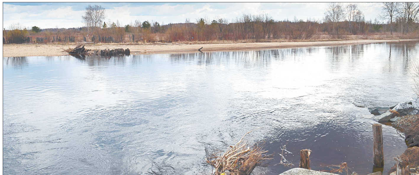
С обрушением моста правый берег опустел

Сейчас о том, что здесь когда-то была переправа, говорят только остатки вбитых свай, что торчат из воды. А ведь совсем ещё недавно мост был гордостью и достопримечательностью микрорайона. Молодёжь удостаивали его своим посещением, туда-сюда сновал народ, переходя с правого берега на левый и наоборот, чтобы пожарить шашлычков, порыбачить, сходить в лесок за ягодами-грибами. Увы, без собственного плав-