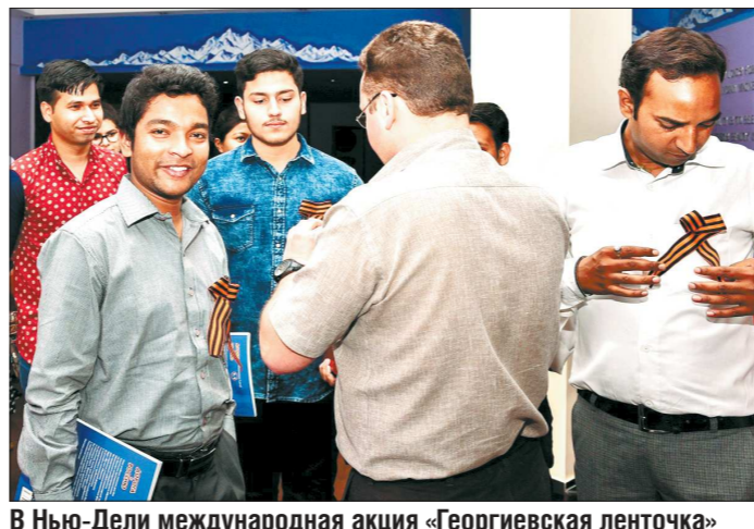
В Нью-Дели международная акция «Георгиевская ленточка» стартовала 26 апреля, в день уважения подвигу советских солдат ленточку пожелали получить не только наши соотечественники, но и коренные индийцы

— Я была одним из инициаторов акции «Бессмертный полк» в Ларнаке в 2015 году, когда она состоялась в первый раз. В этом году планируется провести её также в Лимассоле. Я горжусь тем, что пронесла портреты своих дедов, участников войны. Один из них дошёл до Берлина и прожил сто лет. В этот день они прошли со мной по Кипру, о котором они, возможно, тогда и не слышали. После шествия в церкви Святого Лазаря прошёл молебен на греческом и русском языках по погибшим войнам. Он завершился минутой молчания. В шумном до этого дворе церкви стало вдруг так тихо, что были слышны только звуки метронома. Даже киприоты, которые сидели рядом с церковью на террасах кафе и таверн, в этот момент встали из-за столов, отдавая дань памяти погибшим. С каждым годом на «Бессмертный полк» приходит всё больше людей, все ждут это событие, печа-