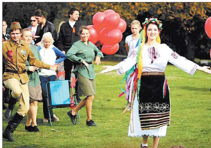
День Победы на другом континенте, в Новой Зеландии, не такой масштабный, но благодаря усилиям россиян становится очень душевным

Организовано всё русское сообщество. Там костяк — те, кто живёт в Новой Зеландии уже много лет, в основном это люди за 40 лет. На праздничном вечере, посвящённом 9 Мая, было очень душевно. Спортивный зал одной из школ: столы с чаем, музыка, декорации. Каждый принёс на стол что-то своё. Всего собралось больше сотни человек: самый младший был в слинге, а самый пожилой — дядеч-