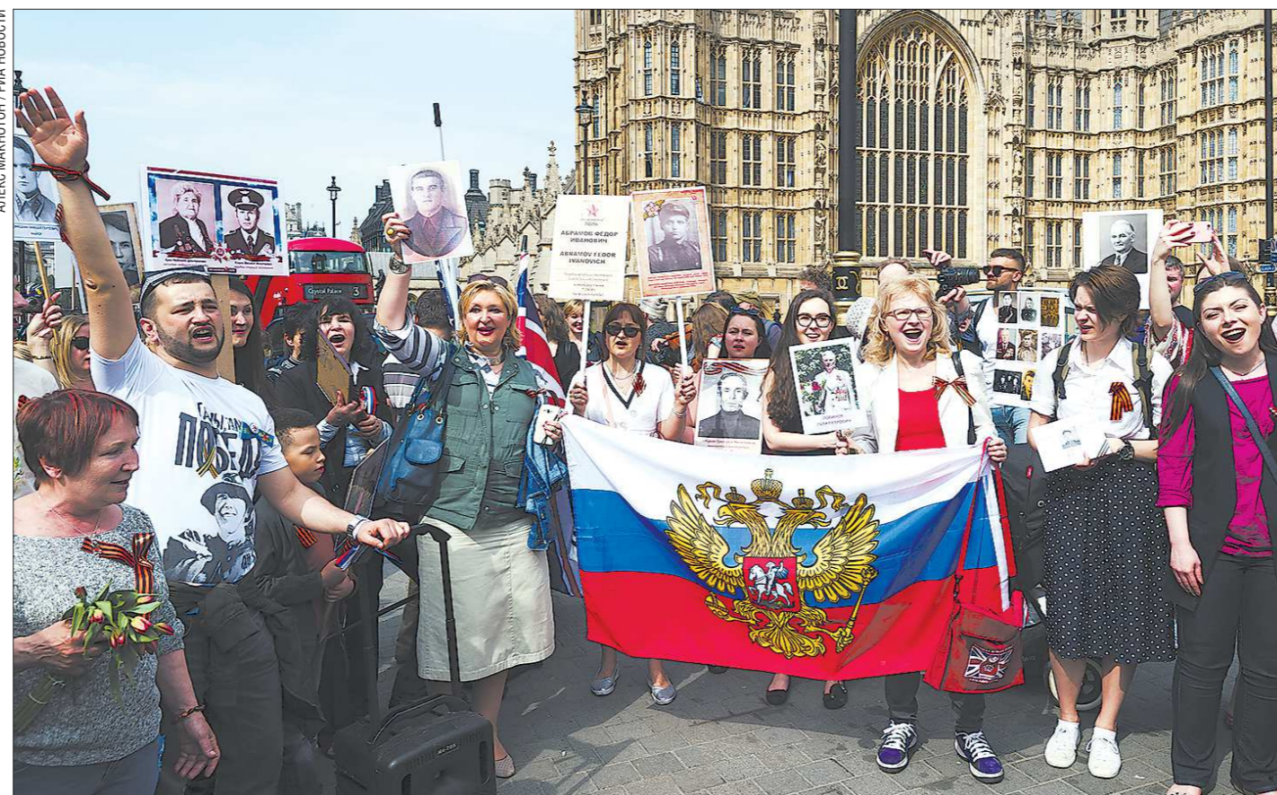
Так 9 Мая 2016 года по улицам Лондона прошли в «Бессмертном полку» жители Великобритании