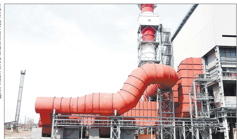
На площадке УАЗа сейчас осуществляется ещё один масштабный проект — строительство газоочистной установки