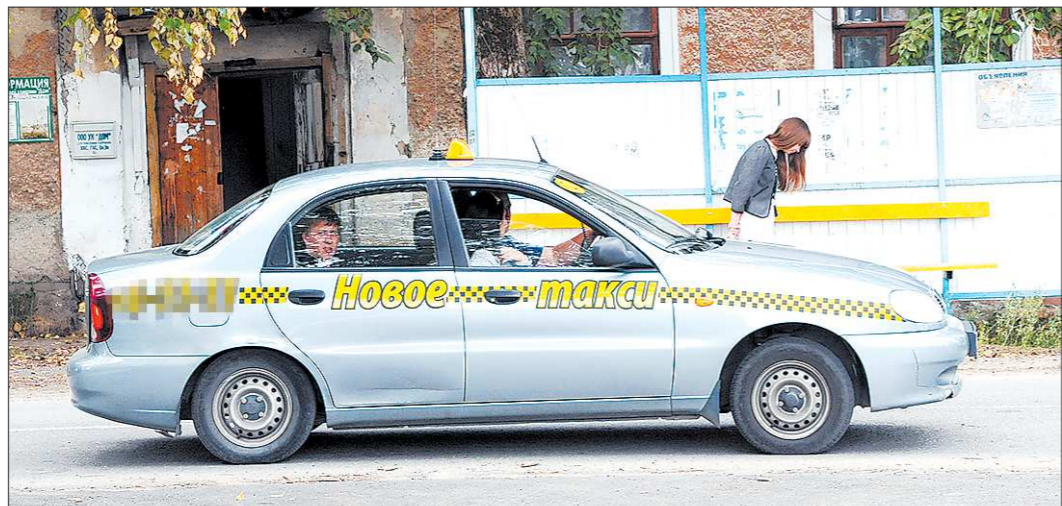
Вызов такси по телефону — сегодня уже прошлый век. Сегодня для этой цели существуют десятки мобильных приложений

Мобильные сервисы по заказу такси сломали не только их традиционный рынок, но и наше восприятие этих услуг. Если раньше такси считалось элементом роскоши, то сегодня это просто ещё одно средство передвижения.