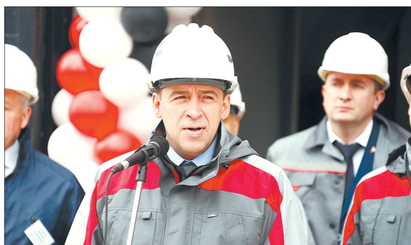
Глава региона Евгений Куйвашев отметил, что сегодня УАЗ — это конкурентоспособное предприятие с высокотехнологичным производством

Но это исключение из правил. Обычно же происходит так, как было на выборах в Кушвинскую думу в прошлом году. В тех выборах приняли участие 12 иногородних кандидатов.