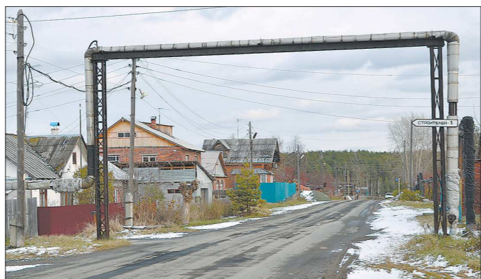
Ново-Кирпичный — типичный заводской посёлок

Асбест не только лишился более трёхсот рабочих мест, что для моногорода болезненно, — накануне зимнего сезона в прошлом году остались без источников отопления и горячей воды жители Ново-Кирпичного. Люди неоднократно обращались в городскую администрацию, в редакцию «Асбестовского рабо-