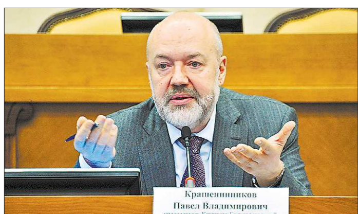
Ещё до назначения Евгения Куйвашева на должность главы региона Павел Крашенинников публично выражал свою уверенность в том, что Президент соответствующий указ подпишет. Прогноз сбился