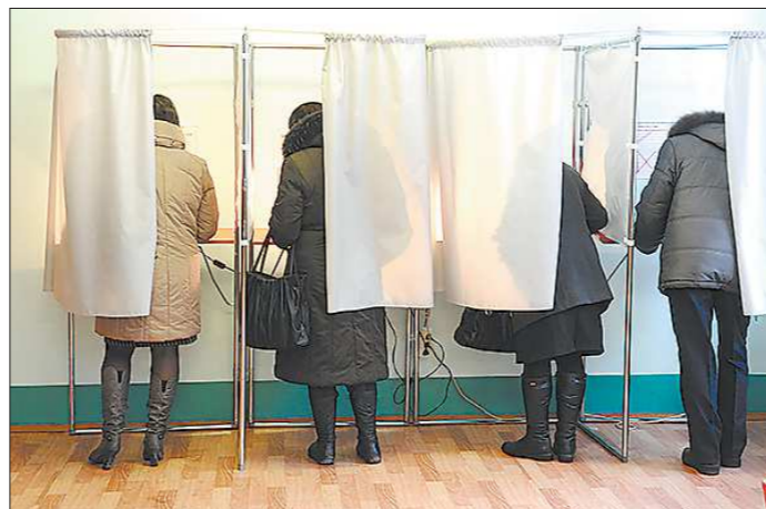
10 сентября избиратели многих населённых пунктов Среднего Урала получат на руки до трёх бюллетеней с претендентами на пост губернатора, мэров и депутатов местных дум

— Расскажите об особенностях выдвижения кандидатов? — Их не так много. Выдвижение на местных выборах