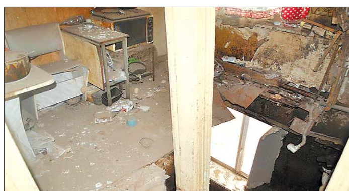
В программу переселения из ветхого и аварийного жилья дом не попал. Хотя сейчас он точно подходит по всем параметрам