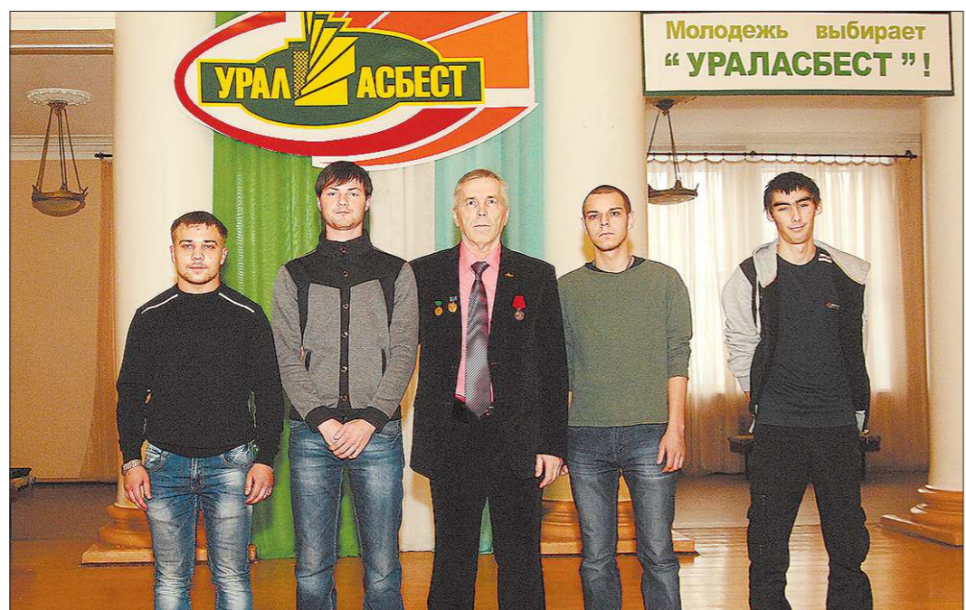
Молодежь выбирает «УРАЛАСБЕСТ»!