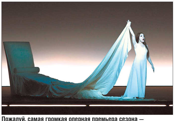
Пожалуй, самая громкая оперная премьера сезона — «Травиата» американского режиссёра Роберта Уилсона и дирижёра Теодора Курентзиса, поставленная в Пермском театре оперы и балета