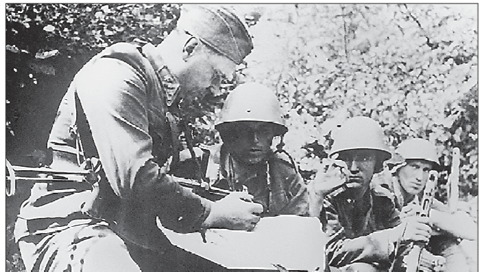
1944 год. Словацкое национальное восстание. Группа словацких партизан на боевом задании