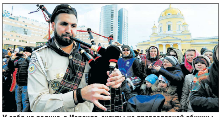
У себя на родине, в Израиле, скауты из православной общины привыкли сопровождать крестные ходы с вольняками и барабанами