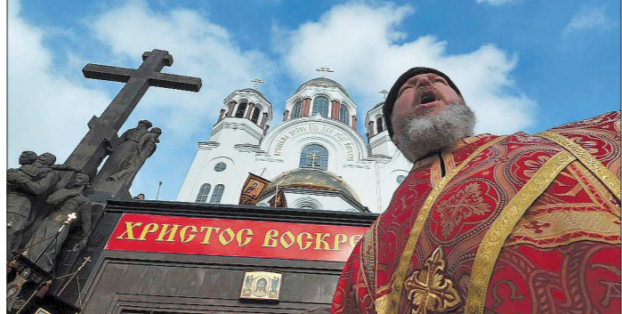
В шествии приняли участие несколько десятков священнослужителей