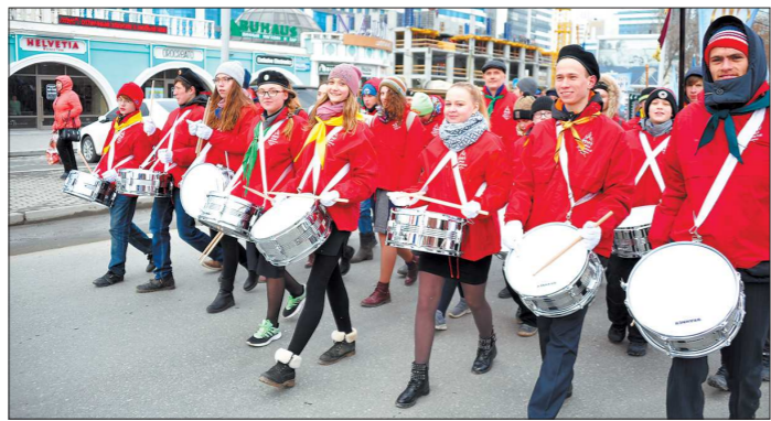
Под бой барабанов шли около тысячи детей — православные следопыты, кадеты, суворовцы и ученики воскресных школ