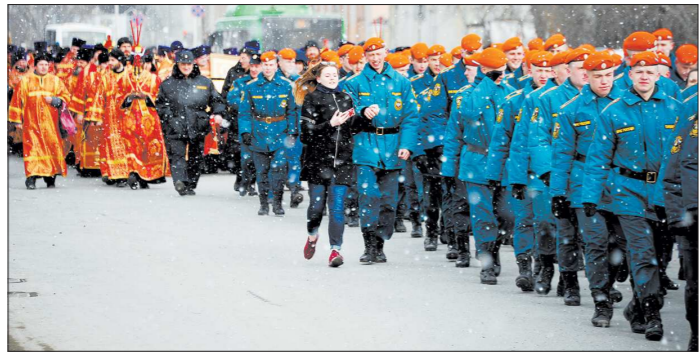
В молитвенном шествии участвовали и студенты Уральского института МЧС