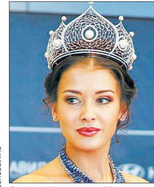
София Никитчук, «Мисс Россия-2015» (родилась в Снежинске, но на конкурсе представляла Екатеринбург), 1-я вице-мисс Мира-2015