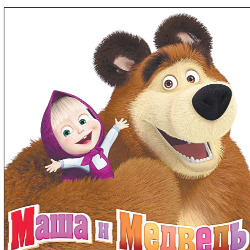
В настоящее время создаётся третий сезон мультфильма, где запланировано 72 серии