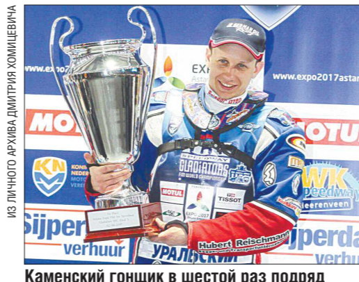
Каменский гончик в шестой раз подряд попадает в тройку сильнейших личного чемпионата мира