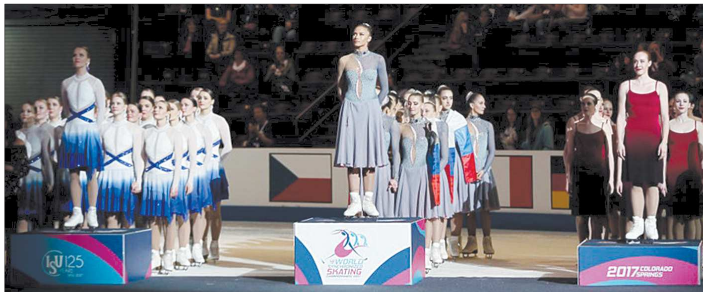
Фигуристки «Парадиза» стали чемпионками мира второй год подряд. Второе место заняла финская команда Marigold IceUnity, замкнули тройку призёров представительницы канадской команды Nexix