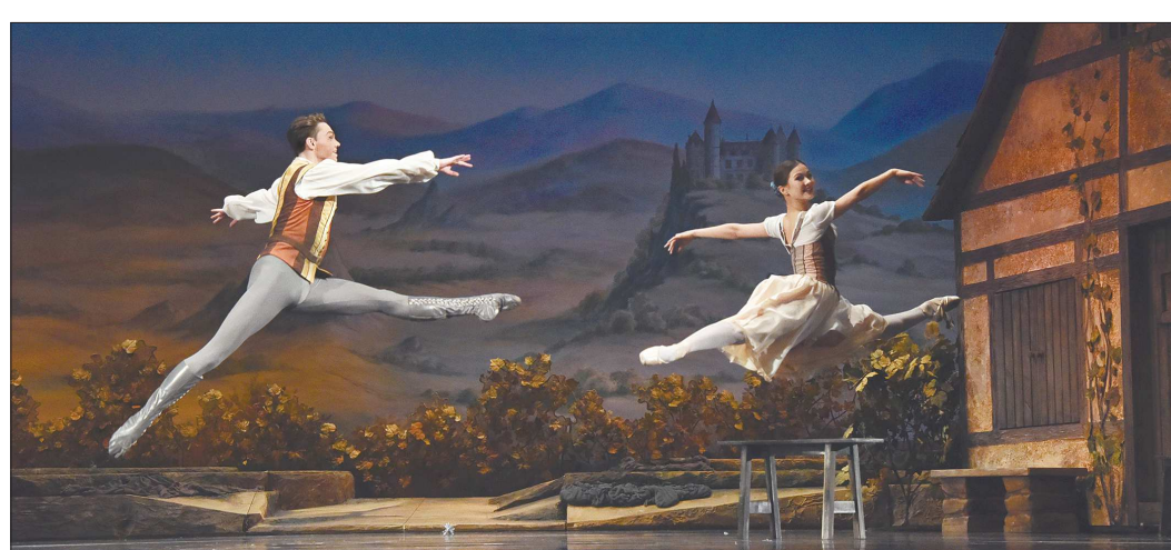
В ранних постановках «Жизели» контраст двух миров был когда-то ещё нагляднее: второй акт танцевали на пунтах, характерный танец в первом акте - на каблучках