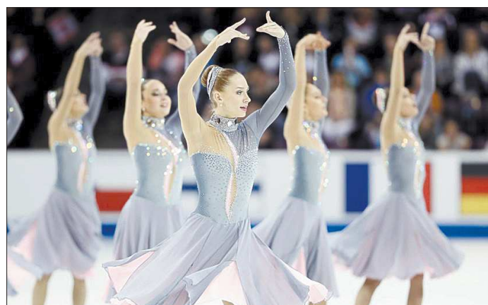
Россиянки, несмотря на менее сложную произвольную программу, чем у соперниц, сумели завоевать золотые медали благодаря качеству выполненных элементов

В американском городе Колорадо-Спрингс завершился чемпионат мира по синхронному катанию. В соревнованиях приняли участие 24 команды из 19 стран мира, а титул сильнейшего коллектива завоевала российская команда «Парадиз».